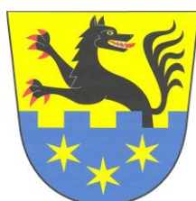
Obrázek 2: znak a vlajka obce