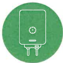
PLYNOVÝ KONDEZAČNÍ KOTEL