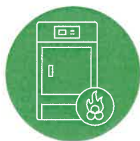
KOTEL NA BIOMASU